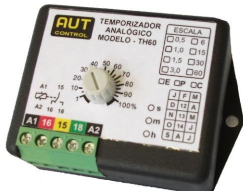
Temporizador analógico Horizontal - Modelo: TH60 Manual e informações